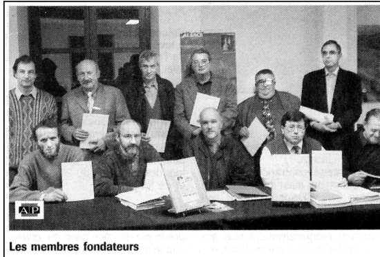
Les membres fondateurs

Le n° 20 de la revue, un varia, parut en décembre.