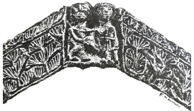
Illustration d'un chapitre de STIFT LAUTENBACH : reproduction par Fernand MAURER d'un chapiteau du porche.