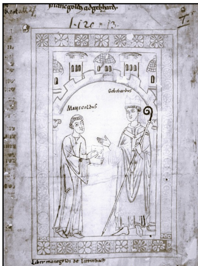
On peut lire au-dessus de la miniature « Manegoldi ad Gebhardum », puis au-dessus des deux protagonistes leur nom, enfin au-dessous « Liber manegoldi de Lutinbach » (Livre de Manegold de Lautenbach) : frontispice du manuscrit de Rastatt datant du milieu du XII e s. et conservé à la Badische Landesbibliothek de Karlsruhe.

vraisemblable en ces temps de longévité limitée. Mais sans doute est-ce le même personnage qu'on retrouve bientôt en Bavière : il y remet sur pied un prieuré augustin tout en poursuivant probablement la rédaction du second livre mentionné ci-dessus. Même si, parmi de tels ravages guerriers, l'ouvrage n'a pas atteint son