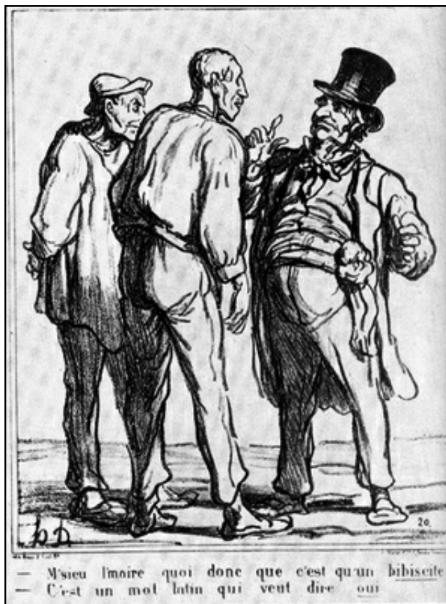
Caricature du plébiscite, lithographie de Honoré Daumier.

(1) D'après « La République et les paysans », article de Chloé GALORIAUX in Parlements, Revue d'histoire politique 2014/3 n°22 pp 107-114.